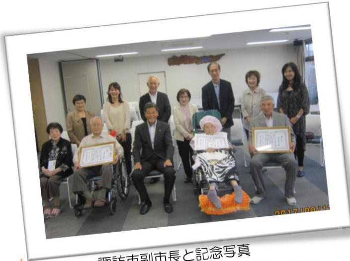
諏訪市副市長と記念写真