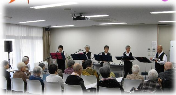
演奏に聞き惚れる観客の皆さまのご様子

10月7日(土)こころのひろば多目的ホールにて、『ハケ岳ハーモニカ倶楽部』の皆さんによる演奏会が開かれました。演奏曲は、「虫の声」や、「青い山脈」「ふるさと」など。美しいハーモニカの音色が奏でる懐かしいメロディに合わせて、参加された利用者の皆様の歌声が響きました。