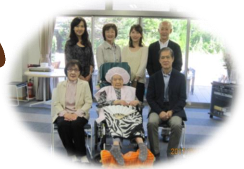
ご家族揃っての記念写真