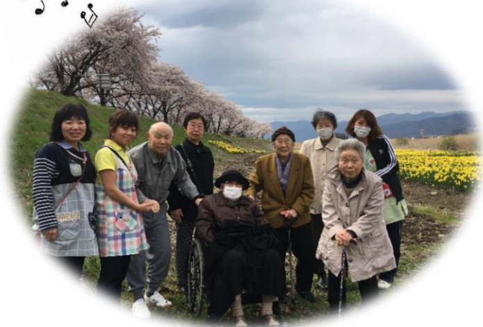
写真左：4月20日のお花見の様子