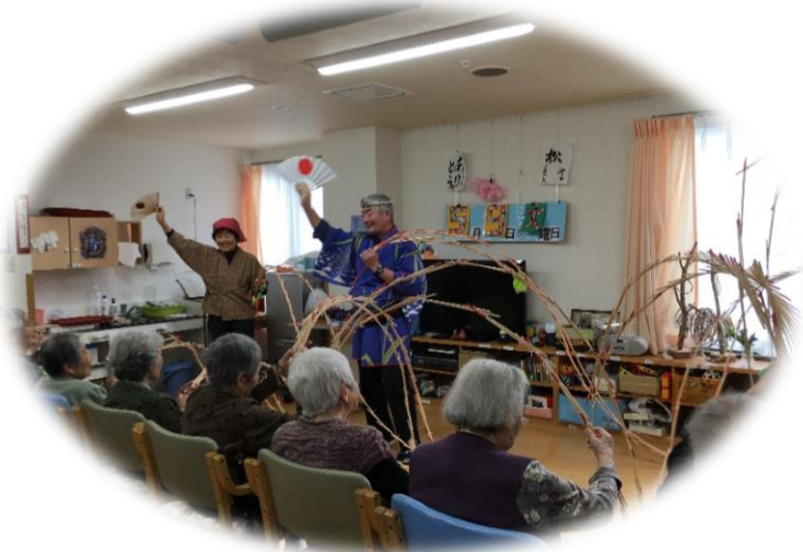
写真下：5月9日のボランティア訪問「玉すだれの会」