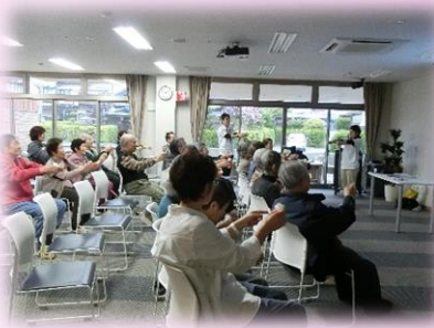
5/12 ダイマル 音楽療法