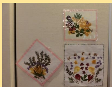
ご利用者さんの作品「押し花」

さすがお母さん！！15人分の 野菜切り♡手慣れた物でアツと 言う間にジャガイモ・人参・玉ね ぎが切れました。入れる肉は奮 発して牛肉です。お蔭で美味し いカレーができました