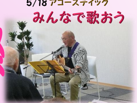
5/18 アコースティック