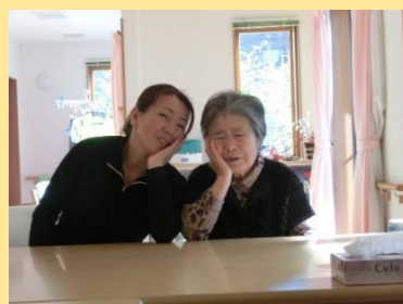
ご利用者さんとツーショット

「ね～ね～あそこに置いてある お団子美味しそうだねえ。食 べたいね」 2人一緒にどうし たらお団子を食べさせてもら えるのか考案しました。