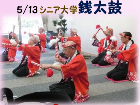
5/13 シニア大学 銭太鼓